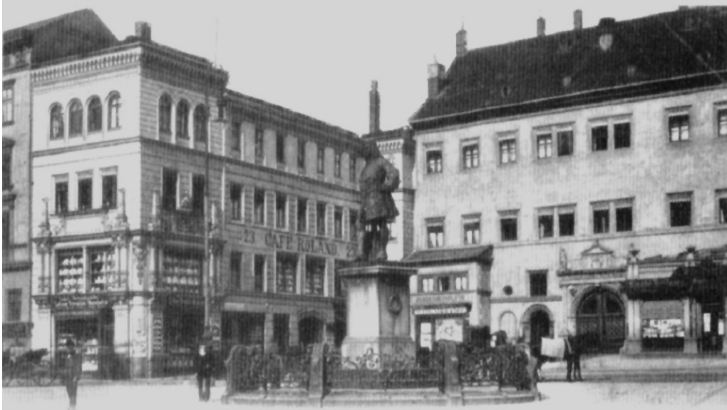
Um 1900: links Markt 23, rechts Markt 24 (Ratswaage, klassizistisch vereinfacht), zur Zeit bebaut mit Kaufhof-Erweiterung