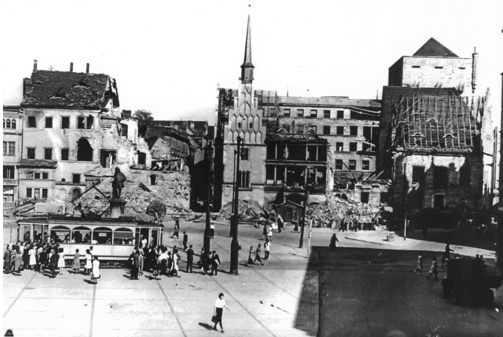
Markt-Ostseite: Ratswaage (links), Altes Rathaus (rechts) und Ratshof (dahinter) 1945